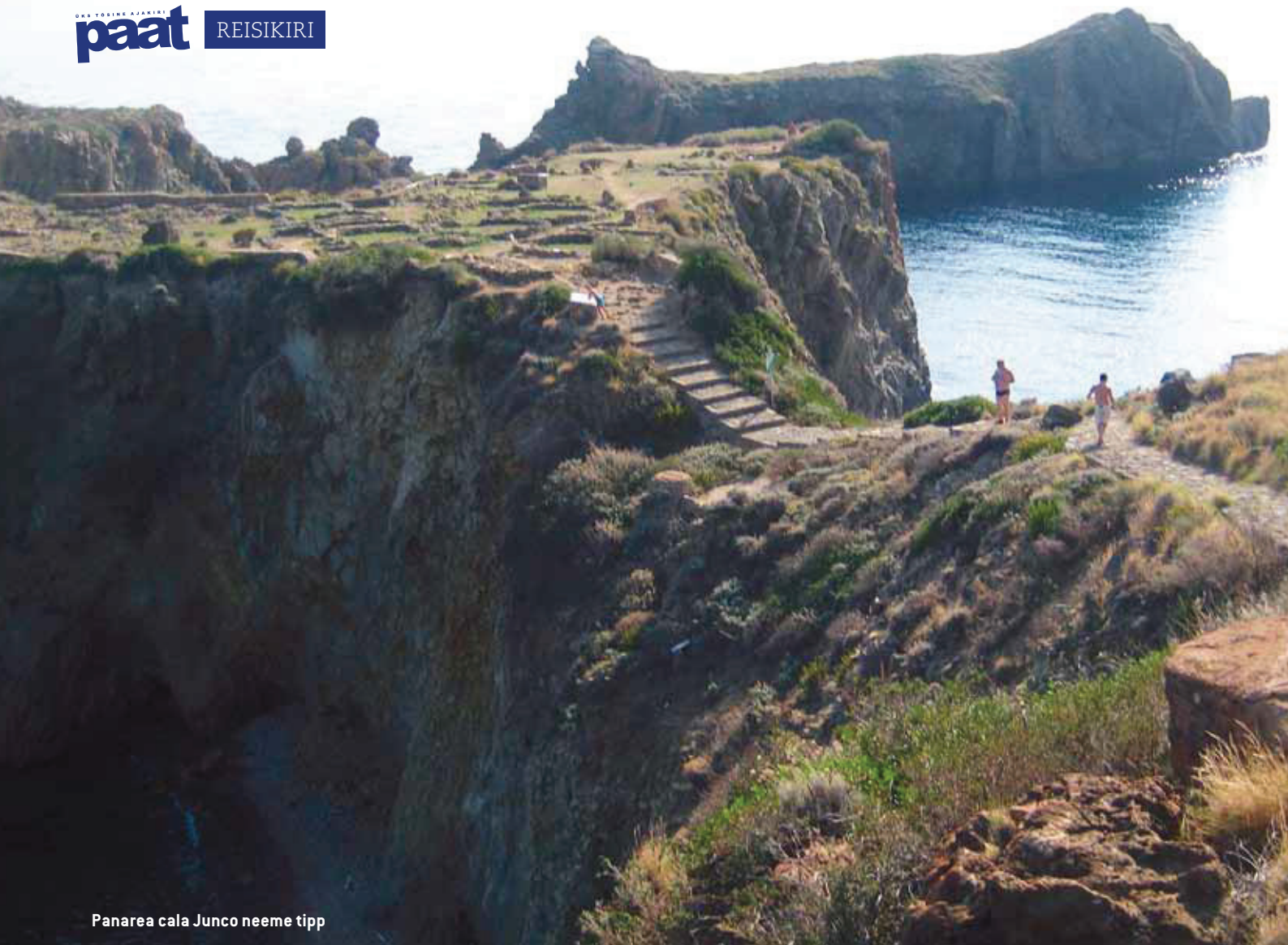
Panarea cala Junco neeme tipp

Inglise keelt räägitakse Sitsiilias vähe, suhteliselt raske on suhelda. Vulcano juures sõitis üks kalapaat jahtide vahel ja müüs kala. Hakkasime kaluriga kaupa tegema, ostsime 2 tundmatu nimega kala. Kauplesime pikalt, tema itaalia ja meie eesti keeles, lõpuks jõudsime kokkuleppele. Saime väga maitsva prae ja õppetunni, et kui kalureid näed, tasub minna küsima. Proovisime ka ise kala püüda, aga kätte saime ainult 10-cm pikkuse kilu. Ei tea neid kohalikke värke, ei ole see nii lihtne midagi. Aga me ei kaotanud lootust, kaks vaprat kalameest püüdsid ikka iga päev.